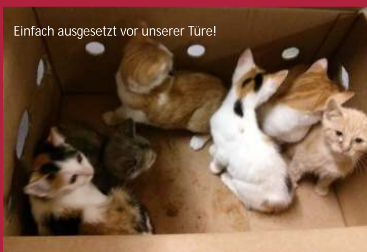
Einfach ausgesetzt vor unserer Türe!

Diese 2 Würfe Katzenbabys hat man feige in der Nacht vor dem Sternenhof-Tor im Karton ausgesetzt. Das war heuer bereits das 4. Mal, anscheinend versteht man uns vielerorts als Entsorgungsstation. Wir können nicht verstehen, warum die Menschen nicht so vernünftig sind, und ihre Katzen kastrieren lassen. Es wäre so einfach, diese Schwemme an „unerwünschten“ Katzenbabys zu verhindern!