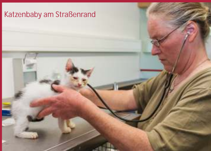
Katzenbaby am Straßenrand

Als ein ehrenamtlicher Helfer von Pocking zur Arche Sternenhof nach Österreich gefahren ist sah er eine kleine Katze neben der Straße liegen. Als er ausstieg um nach der Katze zu sehen, bemerkte er dass sie noch lebt und hat sie sofort zu unserer Tierärztin gebracht. Seit Sonntag ist sie bei der Ärztin und wir hoffen, daß sie es schafft!